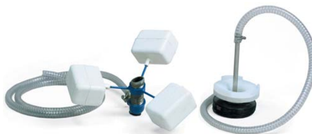
Устройство всасывания поплавкового типа (слева) включено в стандартный комплект поставки. Дополнительное сифонное устройство (справа) предназначено для использования в узких пространствах и при малой глубине резервуара (до 100 мм)