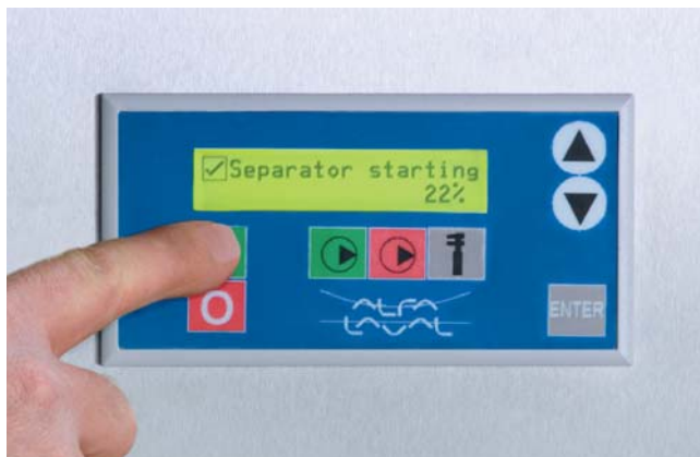
Удобный для оператора пульт управления Alfie 500

Alfie 500 поставляется в комплекте с подставкой, сборной емкостью для отсепарированного масла, устройством поверхностного всасывания, шлангами, набором инструментов для технического обслуживания и руководством по эксплуатации.